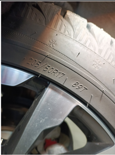
Шины и диски задних колес. Критические замечания