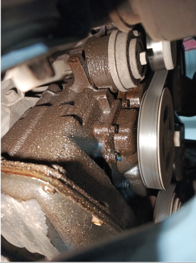
Течь соединений переднего редуктора