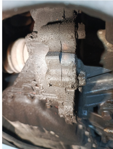
Течь соединений КПП

С транспортным средством и информацией по нему ознакомлен(а):