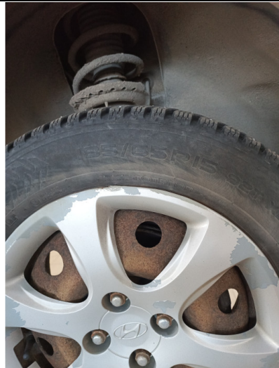
Шины и диски задних колес. Критические замечания

С транспортным средством и информацией по нему ознакомлен(а):