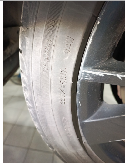
Шины и диски задних колес. Критические замечания

С транспортным средством и информацией по нему ознакомлен(а):