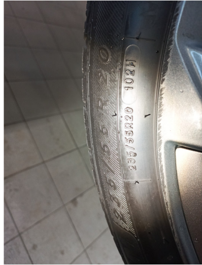
Шины и диски задних колес. Критические замечания