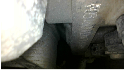
Состояние цилиндров. Эндоскопия.