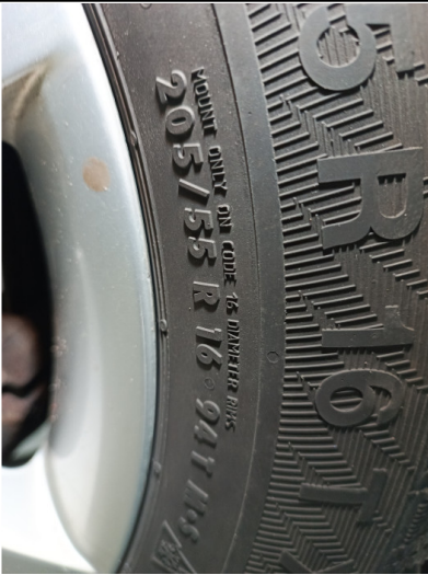
Шины и диски задних колес. Критические замечания