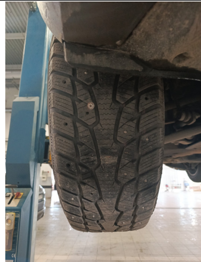
Шины и диски задних колес. Критические замечания

С транспортным средством и информацией по нему ознакомлен(а):