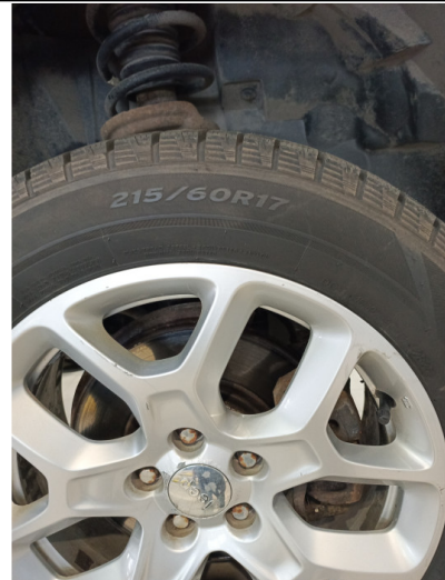
Шины и диски задних колес. Критические замечания

С транспортным средством и информацией по нему ознакомлен(а):