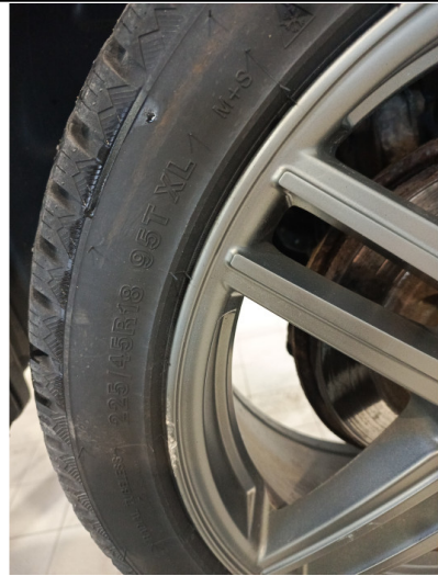
Шины и диски задних колес. Критические замечания