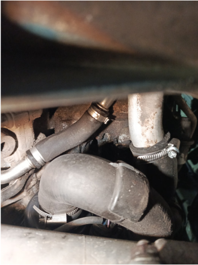
Течь соединений переднего редуктора