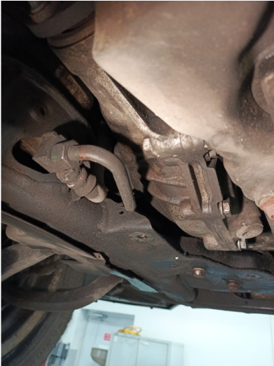
Течь соединений КПП

С транспортным средством и информацией по нему ознакомлен(а):