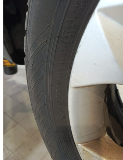
Шины и диски задних колес. Критические замечания

С транспортным средством и информацией по нему ознакомлен(а):