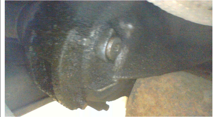
Течь соединений системы ГУРа (осмотр снизу)