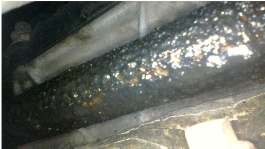
Течь соединений переднего редуктора