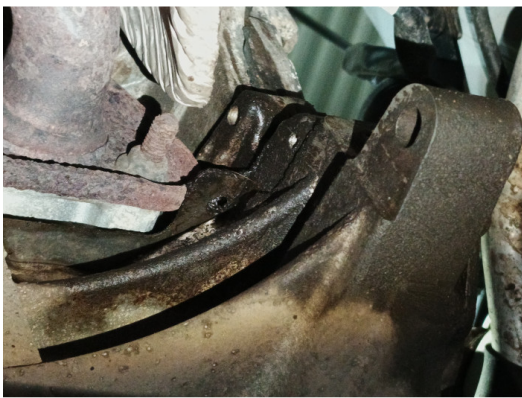
Течь соединений КПП