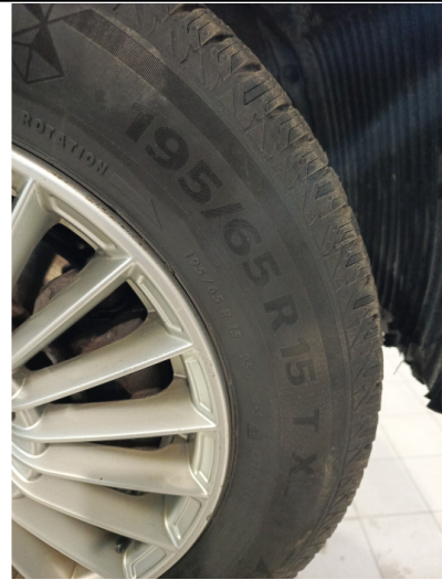
Шины и диски задних колес. Критические замечания