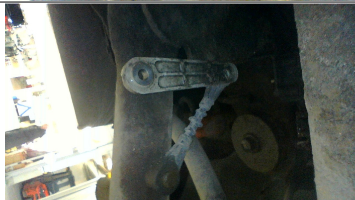
Течь соединений переднего редуктора