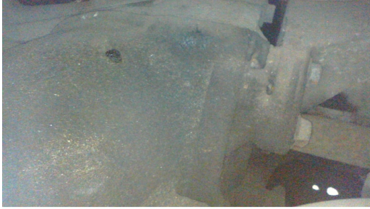
Течь соединений КПП