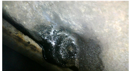
Течь соединений заднего редуктора

С транспортным средством и информацией по нему ознакомлен(а):