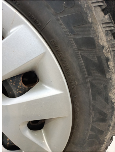
Шины и диски задних колес. Критические замечания