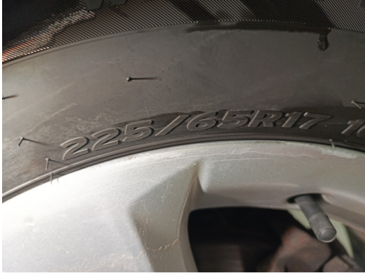
Шины и диски задних колес. Критические замечания