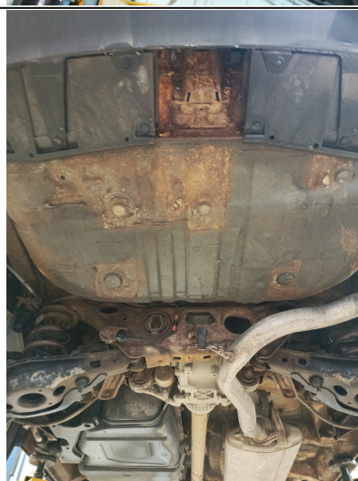
Течь соединений передней крышки ДВС (осмотр снизу)

С транспортным средством и информацией по нему ознакомлен(а):