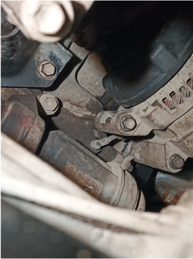
Течь соединений переднего редуктора