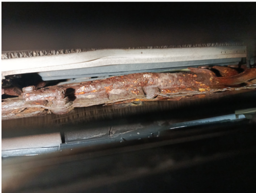
Радиаторы систем охлаждения двигателя, ГУРа, трансмиссии, радиатор кондиционера, опоры ДВС и КПП.

С транспортным средством и информацией по нему ознакомлен(а):