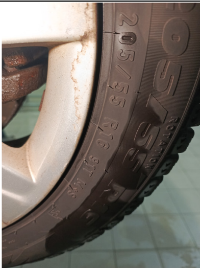
Шины и диски задних колес. Критические замечания

С транспортным средством и информацией по нему ознакомлен(а):