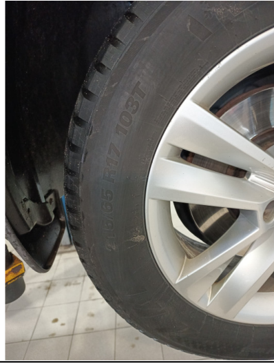
Шины и диски задних колес. Критические замечания