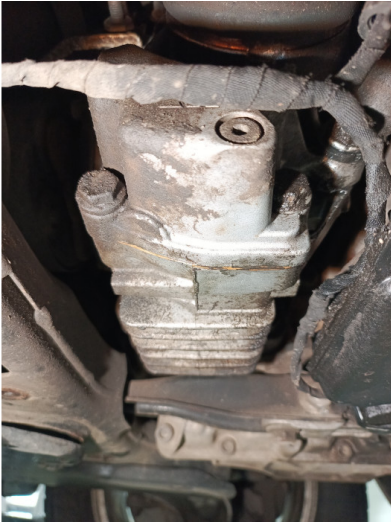
Течь соединений КПП