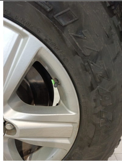
Шины и диски задних колес. Критические замечания