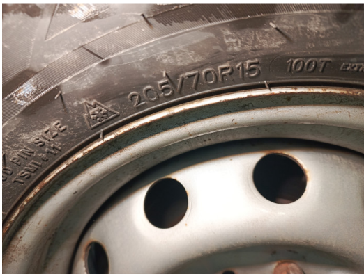
Шины и диски задних колес. Критические замечания

С транспортным средством и информацией по нему ознакомлен(а):