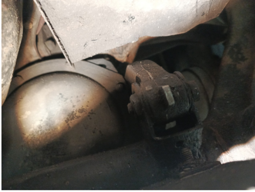
Течь соединений КПП