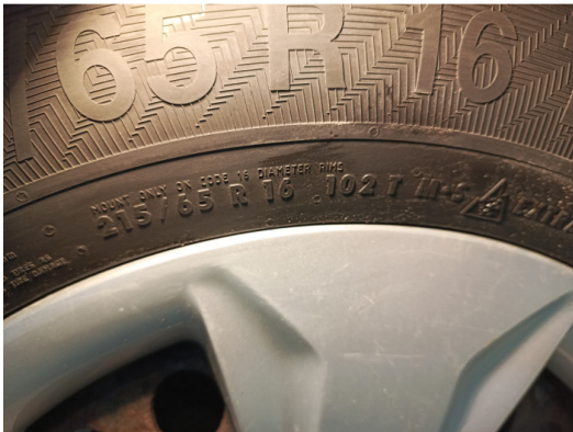
Шины и диски задних колес. Критические замечания

С транспортным средством и информацией по нему ознакомлен(а):