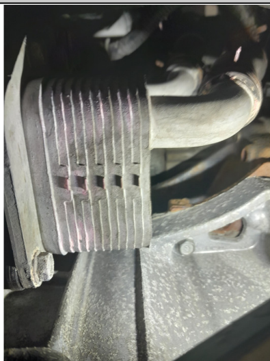
Течь соединений передней крышки ДВС (осмотр снизу)

С транспортным средством и информацией по нему ознакомлен(а):