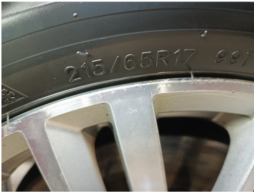
Шины и диски задних колес. Критические замечания