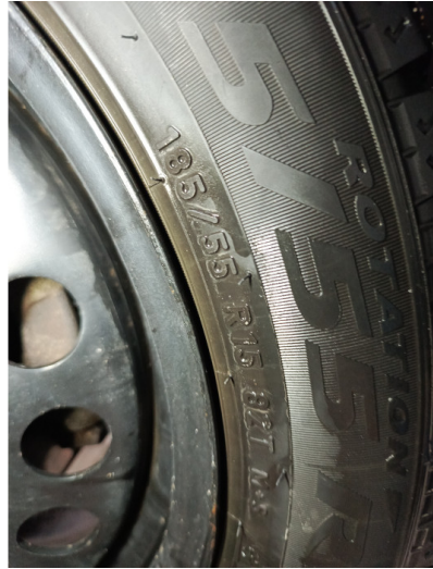
Шины и диски задних колес. Критические замечания