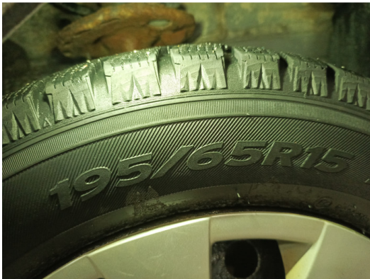
Шины и диски задних колес. Критические замечания

С транспортным средством и информацией по нему ознакомлен(а):